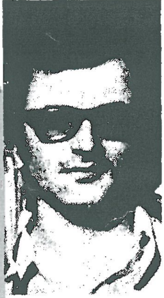
Ο Πίμπα στην Άθήνα, τόν περασμένο Νοέμβριο...

Δέν μεταμελήθηκε αλλά αποκαλύφθηκε από τους πατριώτες στη Γερμανία