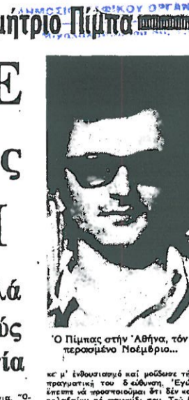
Ο Πίμπτας στην Αθήνα, τόν...