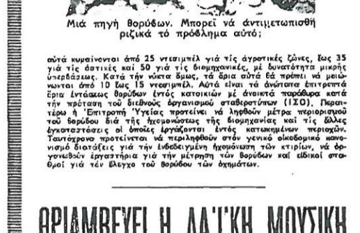
Μιά πηγή θορύβων. Μπορεί να...